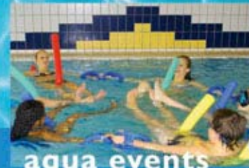
aqua events Veranstaltungen rund ums Wasser