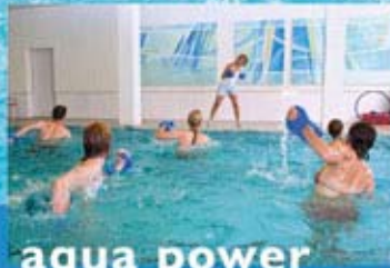
aqua power intensiv und vielseitig