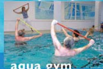
aqua gym Präventionskurs anerkannt von den Krankenkassen